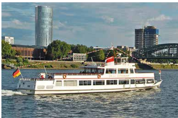
MS Willi Ostermann (optimal für bis zu 150 Personen)